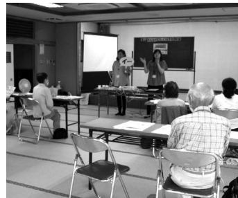
口腔体操にチャレンジ

令和6年6月28日野々下福社会館にて介護予防教室を行いました。今回は「お口の健康維持」と「必要な栄養の摂り方」について歯科衛生士、管理栄養士の方々にお話頂きました。自分の噛む力を評価するガムの体験や、自分の身体を使った簡単な栄養状態の評価を通じて自分の健康について知ることができました。また、自宅で取り入れられる口腔体操や食事の工夫についてもアドバイスを頂きました。