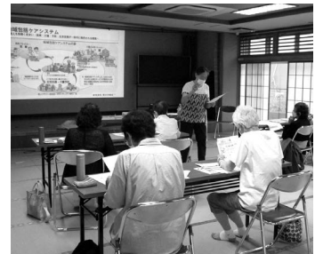
講義後、たくさん質問がありました。